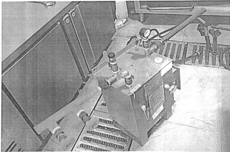
拆除气化器（又名化气炉）照片